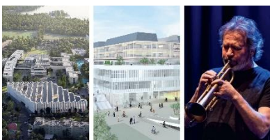
Credits: Snøhetta / aberjung gmbh, di lukas jungmann / Nils Petter Molvær