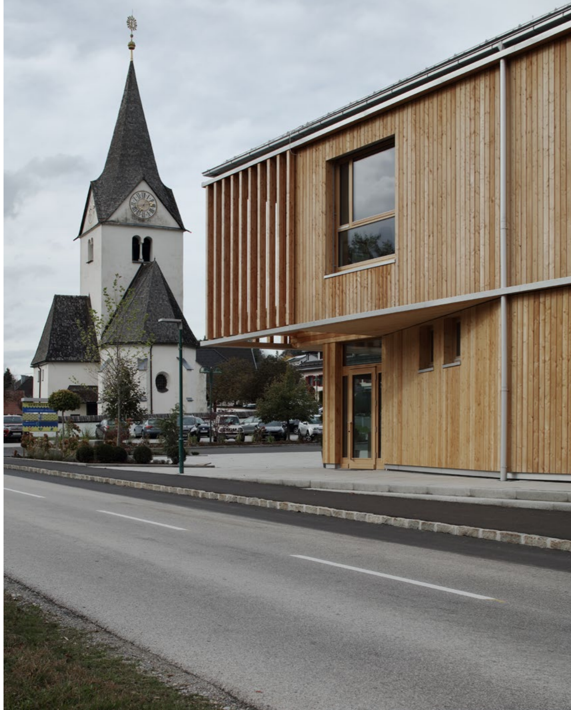
Zadruha 2.0 – Neue Ortsmitte Ludmannsdorf