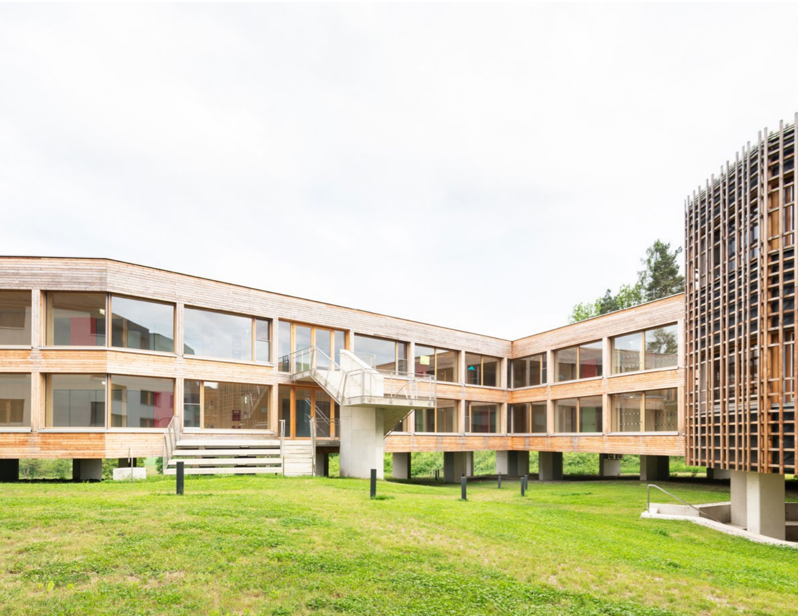
Erweiterung und Sanierung Schülerheim HBLA Pitzelstätten, Klagenfurt